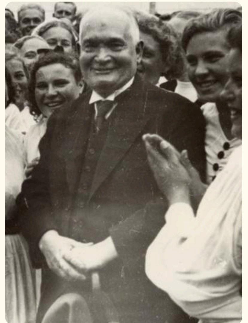
Eesti Vabariigi president K. Päts hiiu rahvatantsijate hulgas Hiiumaal EFA.2.0.27930

Tuleb wälja, et president on lapse sõber – Päts lasi paaril wäikesel poisil oma autos istuda, silitas nende päid ning kinkis perele 300 krooni hambarahaks.